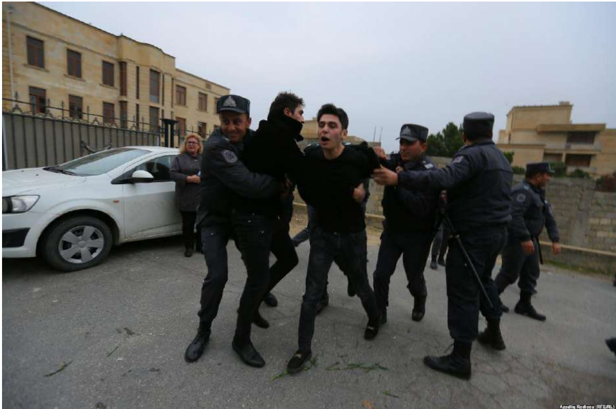
Səbail polis idarəsinin önü, 17 noyabr

İl ərzində siyasi motivli həbslər davam edib və bu səbəbdən siyasi məhbusların sayı artaraq, 129 nəfərə çatıb. Müstəqil mediayaya olan təzyiqlər bu ildə də davam edib, bloklanan müstəqil xəbər saytlarının sayı 40-a çatıb. Müstəqil jurnalistlər və ictimai-siyasi fəallara tətbiq olunan səyahət qadağaları götürülməyib, vətəndaş cəmiyyətinin fəaliyyətinə hüquqi-siyasi məhdudiyyətlər əvvəlki kimi qalıb, sərbəst toplaşmaq azadlığına məhdudiyyətlər davam edib.