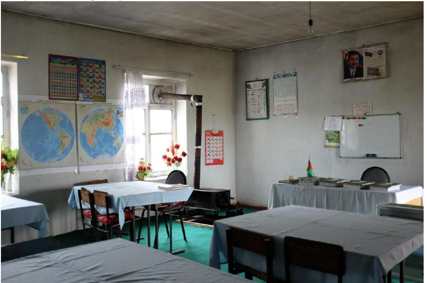
 uşalı m cburi k  k nl rin yaşadıėı q s b d  orta m kt b.   Foto: G lnar S lim

M shahid  olunan pozuntuların 15.5%-i sosial t minat h ququ ilə baėlı olub. Pozuntular  sas n qaz, elektrik v  su t chizatında yaranan fasil l r, azt minatlı ail l rin  nvanlı sosial yardım almaq   n m raci tl rinin t min olunmaması, sosial m avin tl r v  pensiyaların yubanması ilə baėlı  ikay tl ri  hat  edib.