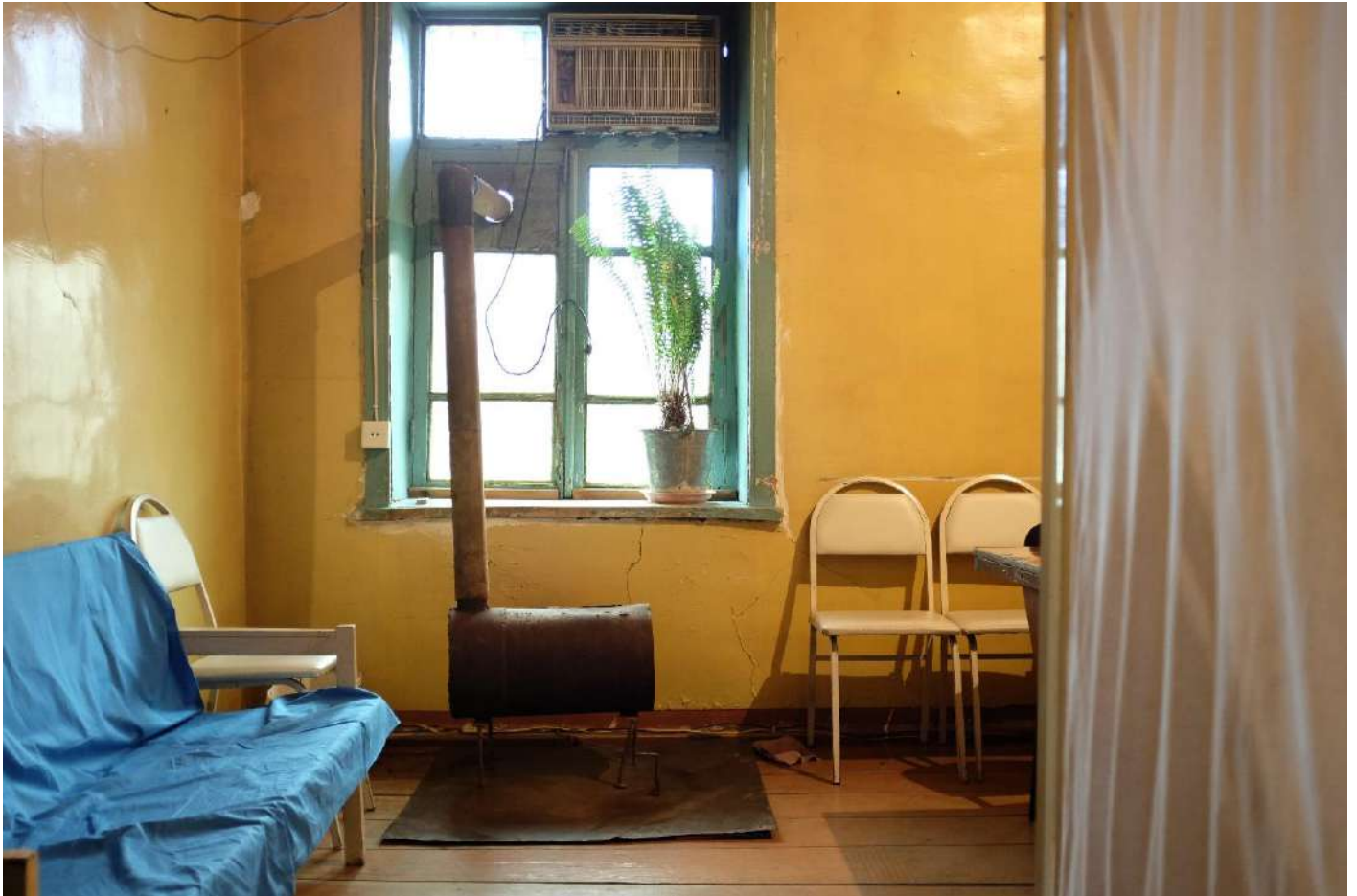
Baş həkimin otağı, Karrar xəstəxanası, Kürdəmir.

Tibbi yardım hüququ ilə bağlı pozuntular qəbul edilən şikayətlərin 3%-ni təşkil edib. Şikayətlər daha çox həkim səriştəsizliyi nəticəsində ölüm hallarının baş verməsi, dövlət xəstəxanalarının xüsusilə rayonlarda lazımı avadanlıqlarla təchiz edilməməsi, dövlət tibb müəssisələrində tibbi xidmətin pulsuz olmasına baxmayaraq, xəstələrdən pul tələb edilməsi ilə bağlı olub.